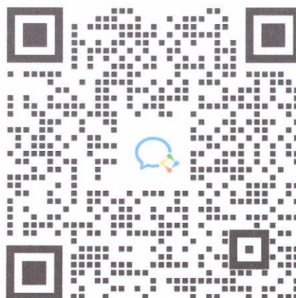
城镇排水管道培训群

3. 请各学员完成报名后，添加培训活动通讯群，以便接收培训活动的最新信息（报名咨询、上课安排、考试安排等）。